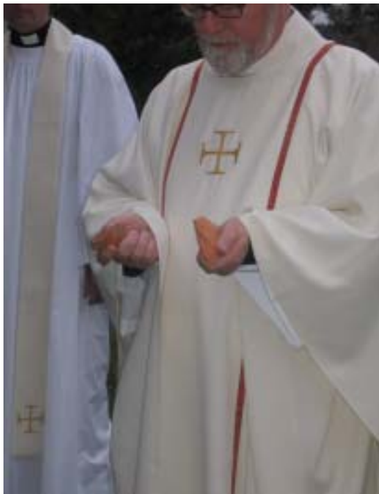
Två stenar nedlades symboliskt på platsen för det nya kapellet, dels en sten ifrån Olaus Petri kyrka dels en sten ifrån Strängnäs Domkyrka. Dessa stenar kommer att muras in i grunden till det nya kapellet.