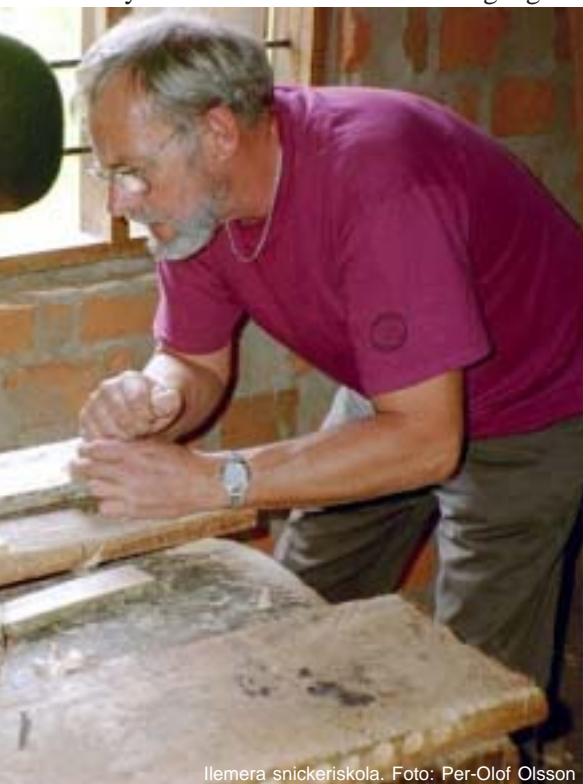
Ilemera snickeriskola.

Gamla elever kallas regelbundet till skolan för seminarier. Det är viktigt att hålla kontakten med dem som lämnat skolan, dels för att höra hur det går och ge råd och stöd, men också för att de nya eleverna får ta lärdom av avgångseleverna hur det är att komma hem till byn som nyutbildad. Det kan vara svårt i starten, många känner sig ensamma, men de flesta lyckas faktiskt försörja både sig och sina syskon på sitt nya hantverksskunnande