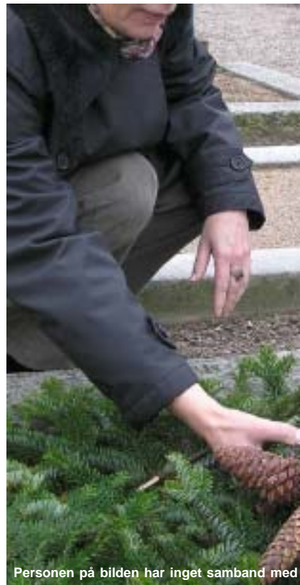
Personen på bilden har inget samband med

En dag fick hon syn på annonsen i tidningen om samtalsgrupp för sörjande. Hon ringde och anmälde sig och fick veta att det skulle bli en mycket liten grupp - hon var den enda anmälda! "Jag blev väl lite tveksam men tänkte att jag går första gången och ser hur det är. Sen tack vare prästens personlighet och det sätt han bemötte mig på så blev jag kvar hela omgången. Jag såg det som att det inte bara var för sorgen - det var ett sätt att få närma sig kyrkan." Hon fick klart för sig att hon även som vuxen kunde få bli en del av församlingen, att bli döpt och konfirmerad.